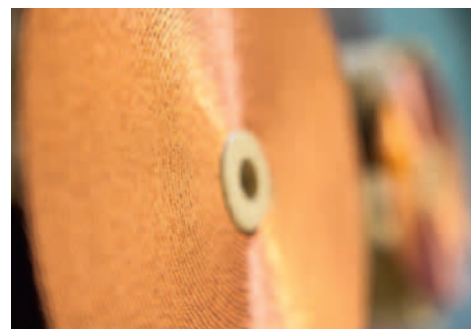
Induktionsspulen werden von INNOVAT selbst hergestellt